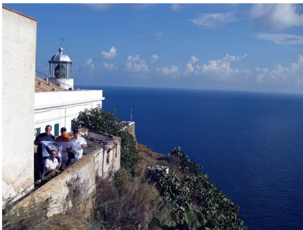
FOTO 2 - Azzurro intenso al Faro