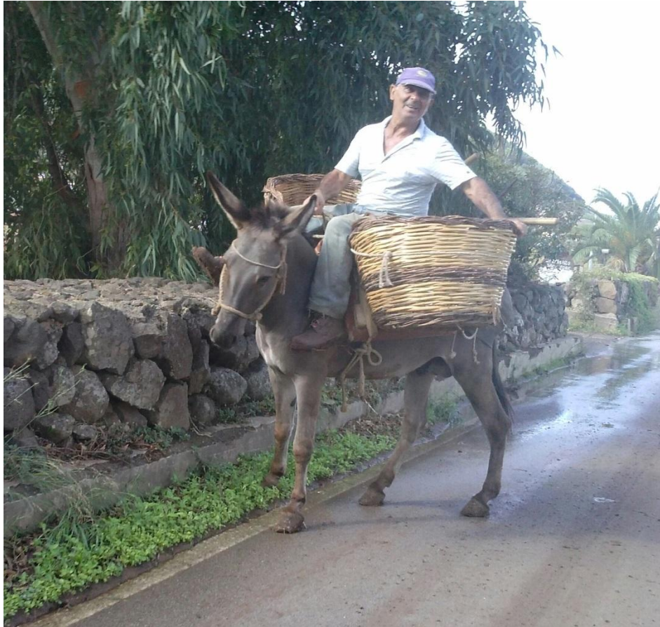
FOTO 3 - Servizio QSL diretto (sicuramente più veloce del Bureau)