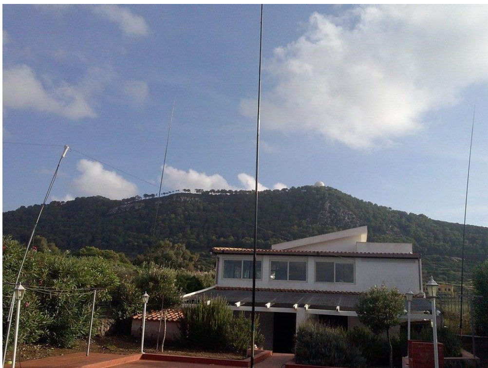
FOTO 1 - Parco Antenne